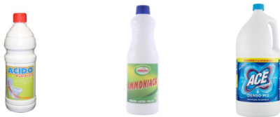
Exemple de produse tipice pentru curățenie în Italia: acid muriatic; amoniac; înălbitor

Fără a uita că contactul cu unele produse poate duce la cazuri de dermatită iritantă sau alergică.