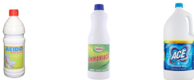
Exemple de produse tipice pentru curățenie în Italia: acid muriatic; amoniac; înălbitor

Fără a uita că contactul cu unele produse poate duce la cazuri de dermatită iritantă sau alergică.